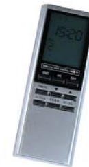
16 kanaler / Timer styrning

Sändare: Extra sändare för nexa's mottagare.