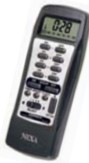
16 kanaler / Timer styrning Gruppstyrning