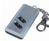
5 kanaler / Nyckelring